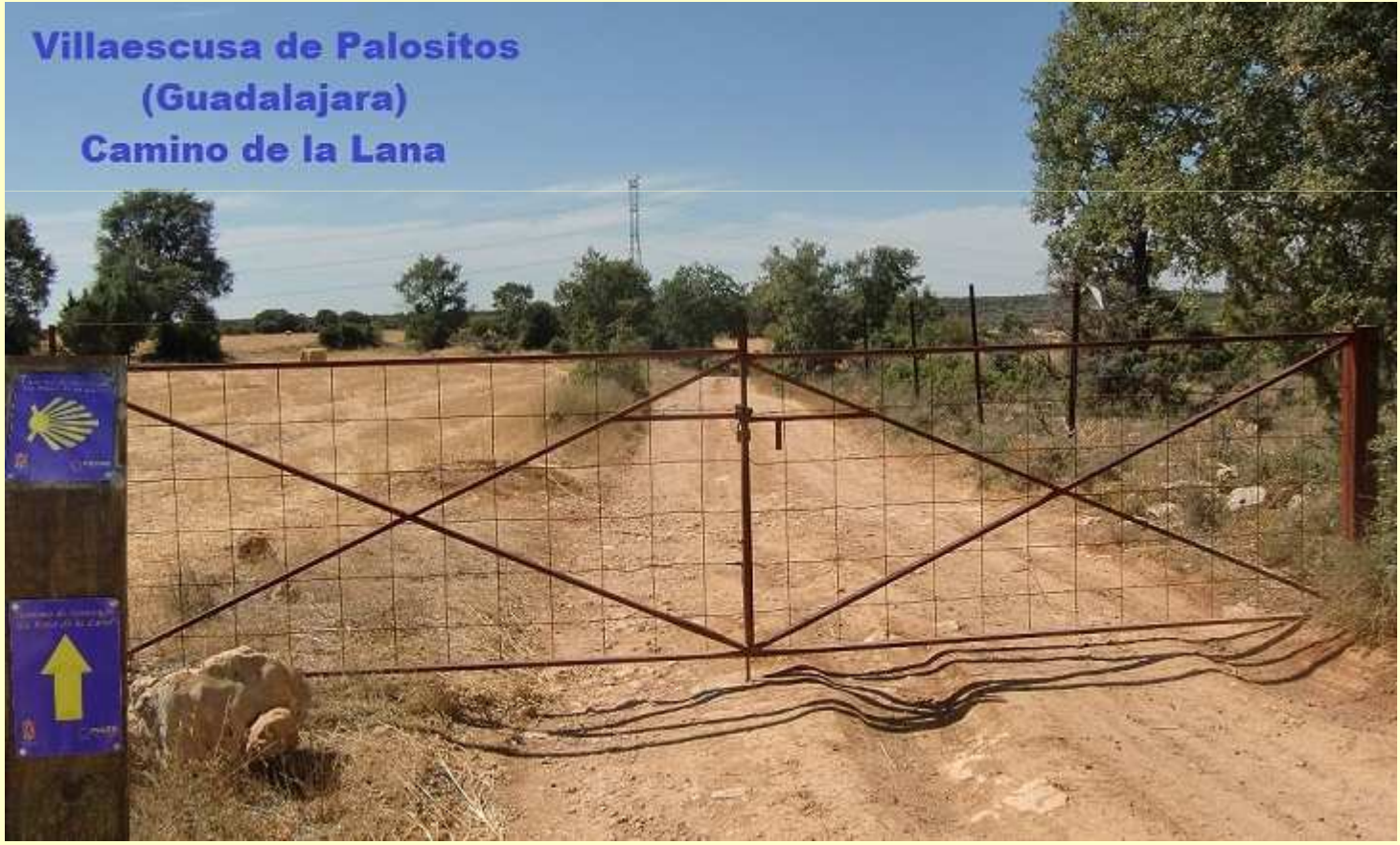
Villaescusa de Palositos (Guadalajara) Camino de la Lana