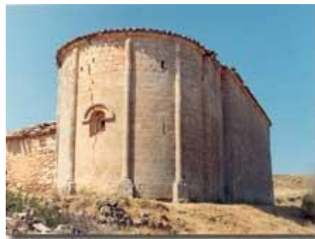
Villaescusa de Palositos (Guadalajara). El ábside de este templo surge sobre un cerro y el pueblo abandonado en una foto de hace unos doce años.

La verdad es que la iglesia románica de Villaescusa es como un milagro permanente aunque hoy sea templo abandonado y digno. Se trata de un elemento de arquitectura netamente románica, en un regular estado de conservación y con una estructura que mantiene en toda su pureza las líneas iniciales con que fue construida. Tiene en el muro de poniente un gran parche, generado en tiempos en que allí debió abrirse un boquete. Y a lo largo del eje central del ábside se está abriendo peligrosamente una gran hienda.