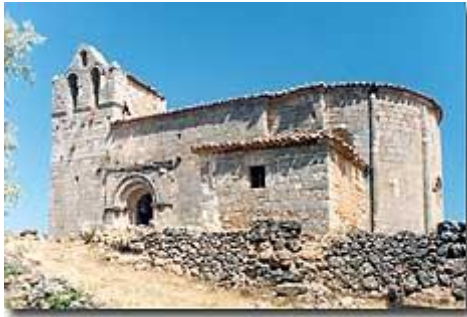
Villaescusa de Palositos (Guadalajara). Aspecto que tenía la iglesia hace unos doce años, antes de haber iniciado su proceso de ruina actual.