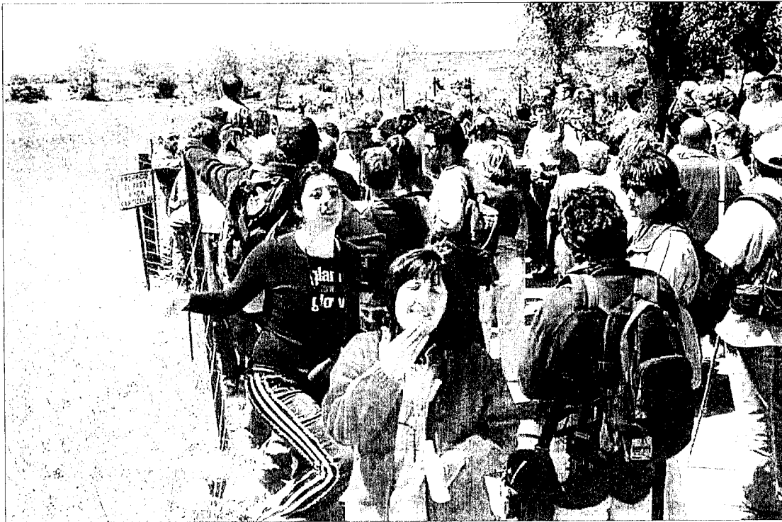
Alrededor de cien personas secundaron la marcha a Villaescusa organizada el pasado 29 de abril.